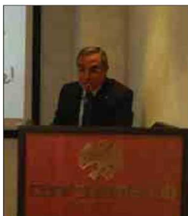
A sinistra il presidente di Confcommercio, Fausto De Mare. Positivo il giudizio sui dati relativi alla nascita di nuove startup in Basilicata ad opera di giovani imprenditori

ad un costante investimento in formazione - la capacità di utilizzare il dato, la preoccupazione per il benessere del cliente più che per il proprio ritorno individuale e l'autonomia di giudizio caratterizzano l'era della conoscenza e rendono il professionista attore indispensabile per aiutare persone ed imprese ad affrontare problematiche nella loro crescente complessità e novità. Inoltre, il crescente peso dei servizi così come il ruolo e valore delle competenze (si parla di "società della conoscenza") hanno accompagnato l'espansione del mondo professionale".