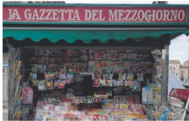
GIORNALI Servono misure di sostegno per le edicole, molte delle quali hanno chiuso