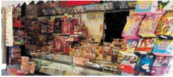
VENDITA Le edicole chiedono forme di sostegno e agevolazioni