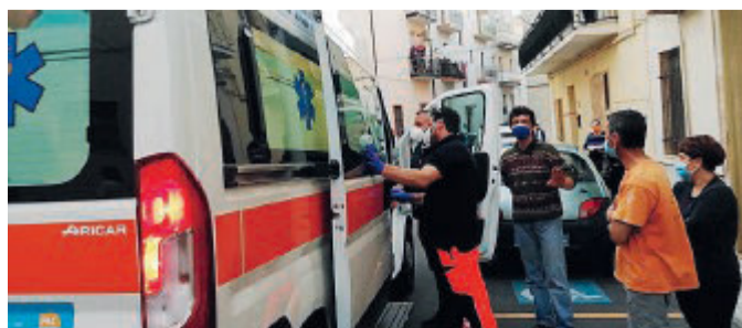
SOCCORSI L'ambulanza del 118 giunta sul posto