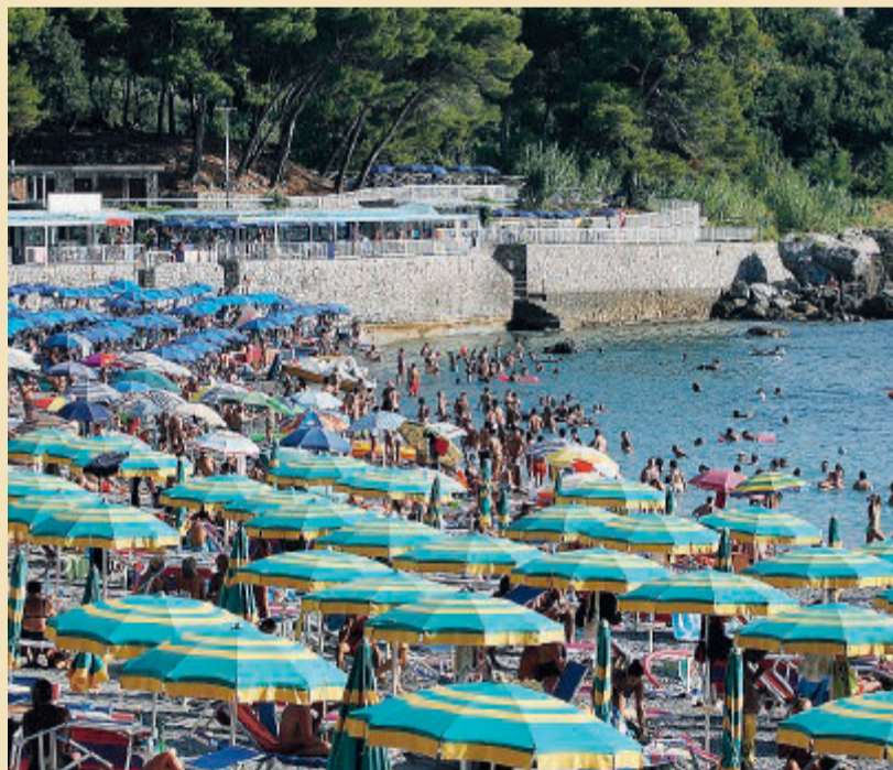
MARATEA Gli ombrelloni prima del Covid. Ora le distanze saranno maggiori