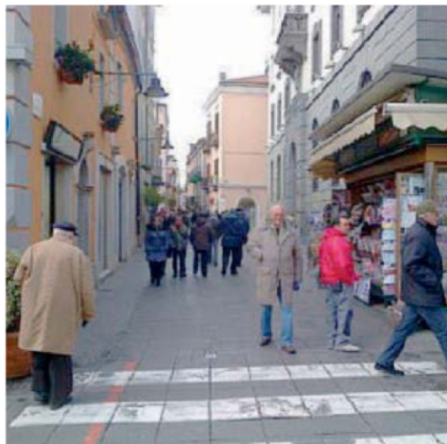
POTENZA I due progetti già approvati riguardano il capoluogo e Melfi