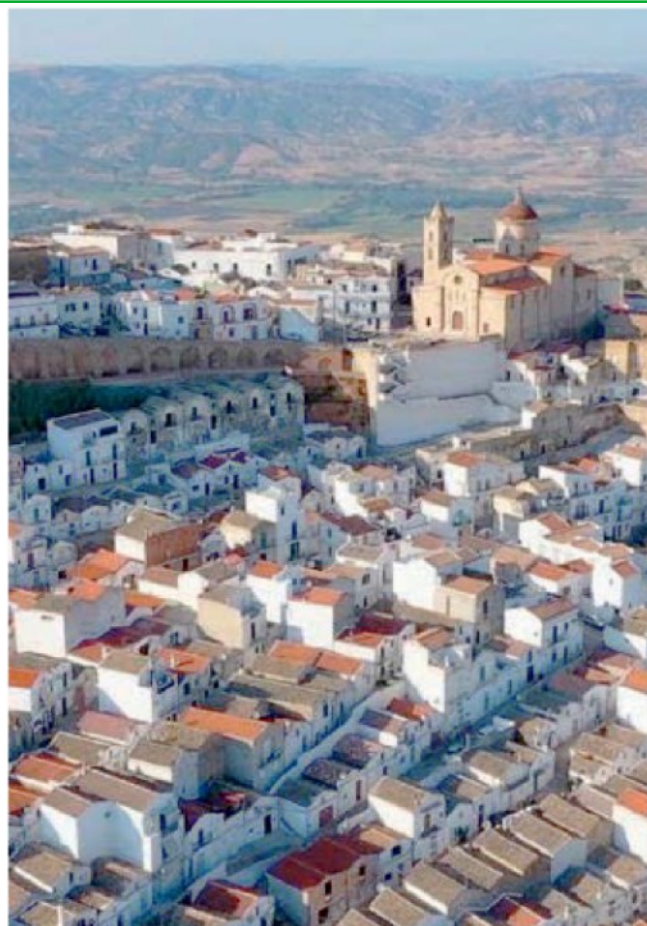
PISTICCI La città ha presentato tre dei sette progetti